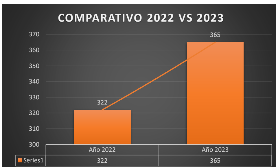
Gráfico N° 3

Se evidencia un incremento del 12% en la emisión de permisos de funcionamiento en comparación al año fiscal 2022, debido a las acciones de socialización y regulación de los establecimientos por cumplir la normativa legal vigente.