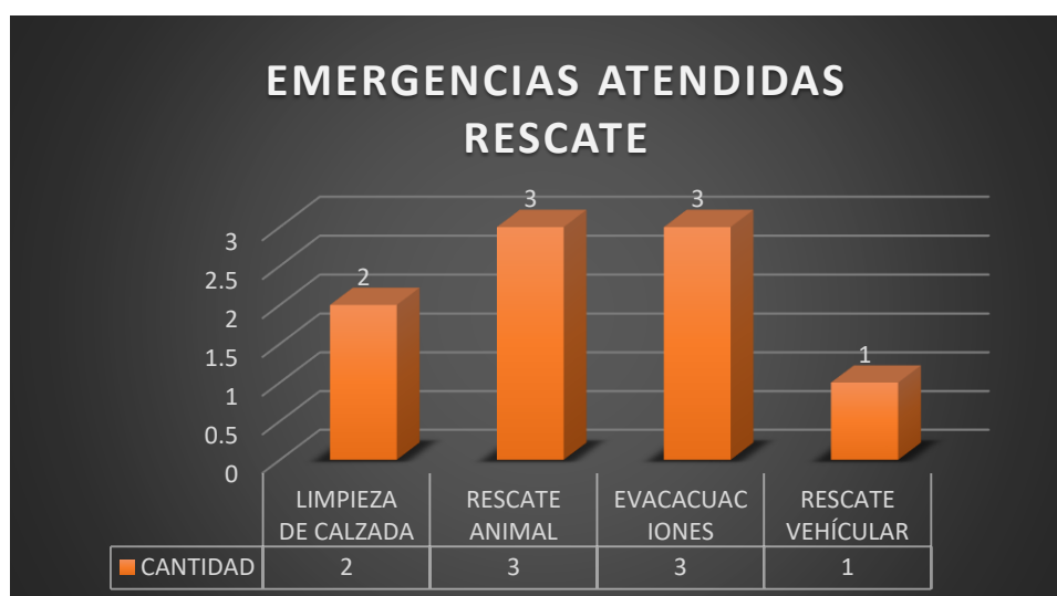
Gráfico N° 6

A través de nuestra Central de Emergencias, se acudió a 9 rescates, tales como limpieza de calzada que se realiza cuando existe derrame de combustible, choques vehiculares, y cuando existen accidentes de tránsito. Así como también, se acude a rescate de animales, rescate inundaciones y rescate vehiculares