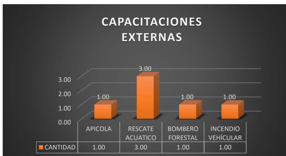
Gráfico N° 8

Personal operativo del Cuerpo de Bomberos de Simón Bolívar también realizó capacitaciones fuera de la Institución Bomberil con la finalidad de seguir capacitándose en diferentes Cuerpos de Bomberos del país, así como también en Academias Bomberiles.