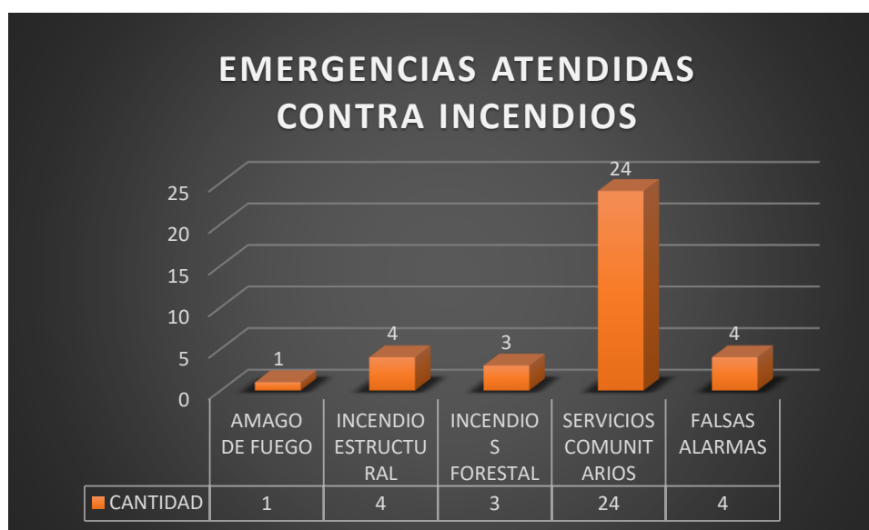
Gráfico N° 4

La gestión del 2023 de la gestión de operaciones atendió 36 incidentes teniendo como principal servicio las ayudas comunitarias con 24 atenciones por desabastecimiento de agua en el Cantón, como se detalla en la siguiente gráfica.