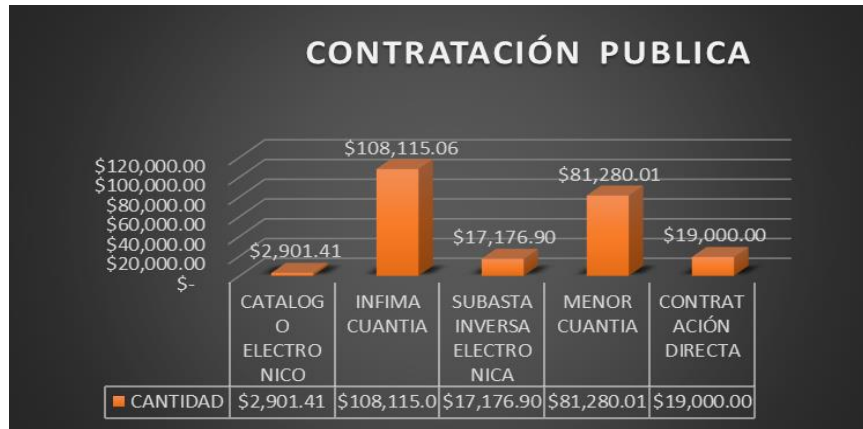
Gráfico N° 9

El cumplimiento del Plan Anual de Contrataciones (PAC) 2023 se planificó un total de 44 procesos a través de sistema nacional de contratación pública; sin embargo, por razones de cambio en temas presupuestarios ocurridas el año pasado, solo se llevó a cabo la celebración de treinta y nueve procesos, lo que equivale a un 88.63% del cumplimiento del PAC 2023 del CBC-SB; y, respecto de los recursos asignados para las contrataciones, se hizo uso de un total de $242.588,29.